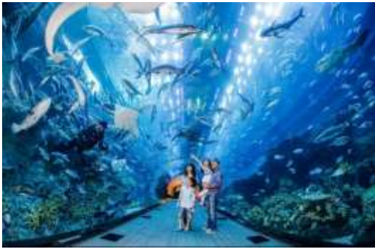
ต่างๆ ทั่วโลก

*** Sea. Aquarium(ยังไม่รวมค่าบัตร) (โปสดแจ่งและชำระค่าบัตรก่อนเดินทาง ได้ในราคา ผู้ใหญ่ 1,350 บาท / เด็ก อายุต่ำกว่า 12ปี ราคา 1,190 บาท) S.E.A. Aquarium เป็นพิพิธภัณฑ์สัตว์น้ำเปิดใหม่ใหญ่ที่สุดในโลกกับ Marine Life Park จัดอันดับให้เป็นอควาเรียมใหญ่สุดในเอเชียตะวันออกเฉียงใต้ ถูกออกแบบให้เป็นอุโมงค์ใต้น้ำ สามารถบรรจุน้ำเค็มได้กว่า 45 ล้านลิตร รวมสัตว์ทะเลกว่า 800 สายพันธุ์ รวบรวมสัตว์น้ำกว่า 100,000 ตัว ตกแต่งด้วยฉากประติมากรรมของเรือ ภายในได้จำลองความอุดมสมบูรณ์ของทะเล